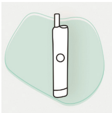
Слика 6. Несагоријевајући дувански производи

Несагоријевајући дувански производи (слика 6) су нова категорија производа који загријавају дуван умјесто да га сагоријевају, са циљем да значајно смање емисију штетних материја које су повезане са сагоријевањем, у поређењу са цигаретама.