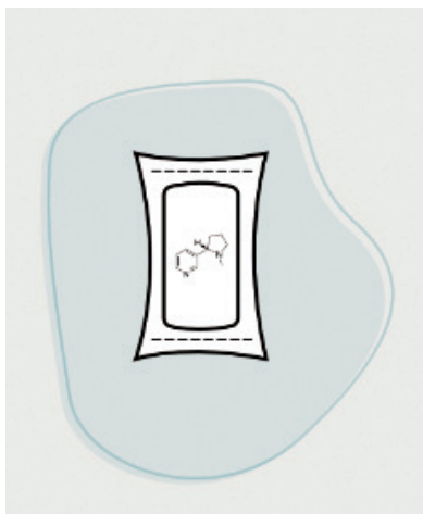
Слика 4. Никотинске врећице

Модерне оралне никотинске врећице (слика 4) користе се на сличан начин као снус, али не садрже дуван већ садрже само никотин, воду и друге састојке за прехранбене производе. У овим врећицама унапријед одређених порција, лист дувана је замењен недуванским пунилом и никотином, са различитим садржајем никотина у различитим географским регионима и брендovima, обично у распону од 4–18 мг никотина по врећици.