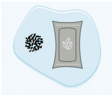
Слика 3. Дуван за оралну употребу

Дуван за оралну употребу (слика 3) је алтернатива цигаретама која се деценијама комерцијализује у земљама као што су Шведска, Норвешка и Сједињене Америчке Државе (САД). Ови производи се могу жвакати или држати у устима, омогућавајући апсорпцију никотина кроз оралну слузокожу. Они се производе пратећи процесе који ограничавају количине непожељних једињења у овим производима, укључујући максималне границе нитрозамина специфичних за дуван.