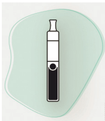
Слика 5. Е-цигарета

Бројне студије су показале да је састав аеросола е-цигарете мање сложен од дима цигарета, са знатно нижим нивоима штетних материја од дима цигарета (Royal College of Physicians, 2016; Mc Neill, 2015; Farsalinos, 2014; Margham, 2016). Међутим, на крају, састојци е-течности и карактеристике уређаја (нпр. радна температура, калем, одводни систем) утицаће на састав аеросола.